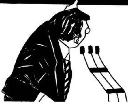
Heykel ve İllüstrasyon: ELİF YILDIZ