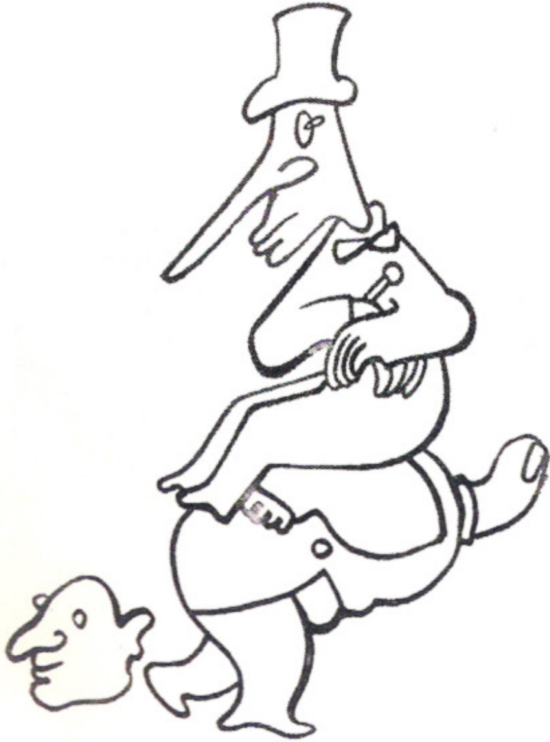
"S.E.S. ile Artist Mecmuası için hazırlanmış bir çizim" Abidin Dino / 1939

Acılı Kuşak, Toplum Yayınevi, 1967, s.26