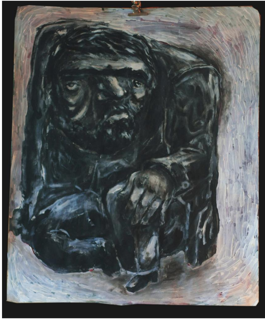
"OTURAN" by Rad

Çok nazik olan toplumsal mekanizmanın gevşediği ve şaşaladığı kriz anlarındaki kadar vahşiliğimizi gösteren hiçbir şey yoktur. Böyle anlarda öğelerin ne yaptıklarını bilmeksizin ve birbirine bağlanmaksızın hareket ettikleri görülür. Burada bencil içgüdülerin baskısı altında toplumsal içgüdülerinin yerlerini bıraktıkları çok öğretici olan hallerden söz etmiyorum. Vaktiyle çok tehlikeli ve enteresan bir kriz -biyresel menfaatlar, ahabaplıklar, kinler hakkında bir şey söylemiyorum- adalet kavramını, hakkında hüküm verilecek konuya ve genel olarak yetkeye saygıyı, yurt sevgisini, daha iyi ve geniş bir insanlık özlemini, hangi cinsten olursa olsun, hakikat uğrunda mücadele fikrini, zorunlu uyuşum duygusunu, idealleştirilmiş soyutlar sevgisini ve hayata imtiyazlar veren gerçekler kaygısını, hepsini, hepsini birden tehlikeye düşürmüştü. Bu yönsemeleri içlerinde taşıyanlardan herbiri kendi vicdanına (...) başvuruyordu. (...) Bir sürü faziletler ortaya çıkıyor, zihinleri şaşırtıyordu. Soyut olarak bunların aralarını bulmak mümkündü, fakat olay içinde bu imkânsızlaştı.