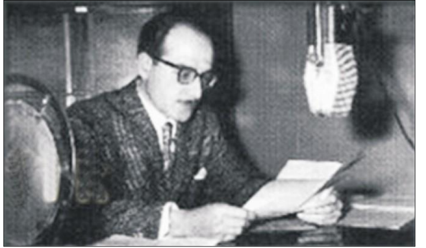
Eşref Şefik Atabey

İstanbul Radyosu'nun ve Güneş Spor Kulübü'nün kurucularından, ilk spor spikerimiz ga- zeteci Eşref Şefik 1 , Marmara Adası'nın en tanınmış simalardan biridir herhalde... Eşref Şefik, yaşlılık döneminde -1970'li yıllardan vefatına kadar- senede altı ay gibi bir süreyle Aba Koyu'na inşa ettiği yazlık evinde yaşamıştır. Eşref Şefik'in oğlu ve efsane kitap koleksiyoneri Şefik Atabey de aynı yazlık evde uzun yıllar komşumuz olmuştur. Çocukluğumdan bu yana Şefik Atabey'in zekası ve özgün kişiliği beni çokça etkilemiştir. Kitap koleksiyonum üzerine ilk tavsiyeleri ve yönlendirmeleri 2000 yılında Şefik Atabey'den aldığımı da not etmeliyim. Ayrıca, Eduardo Galeano'nun müthiş kitaplarını bana tanıtan kişi de Şefik Atabey'den başka biri değildir. Os- manlı İmparatorluğu tarihi ve coğrafyasına ilişkin yabancı dilde -çoğunluğu Avrupa dillerinde- yazılmış kitaplar ve belgeler konusunda en bilgili kişilerden biri olan Şefik Atabey'in 2010 yılın- daki vefatının ardından kitap koleksiyonerliği dünyasında bilgi ve deneyim açısından çok büyük bir boşluk oluşmuştur. 2 Eşref Şefik'in ve Şefik Atabey'in mezarları Marmara Adası'ndadır.